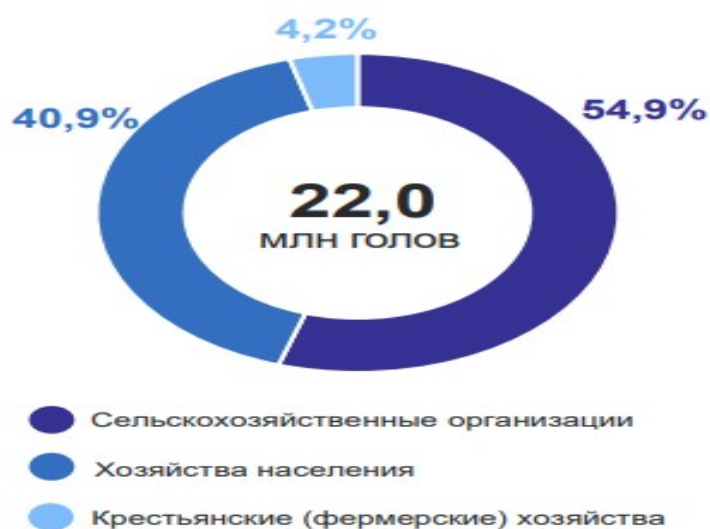
Рисунок 1 – Структура поголовья птицы по категориям хозяйств